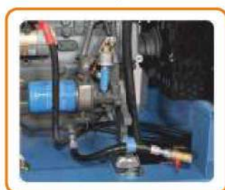
Дополнительный шланг для слива масла