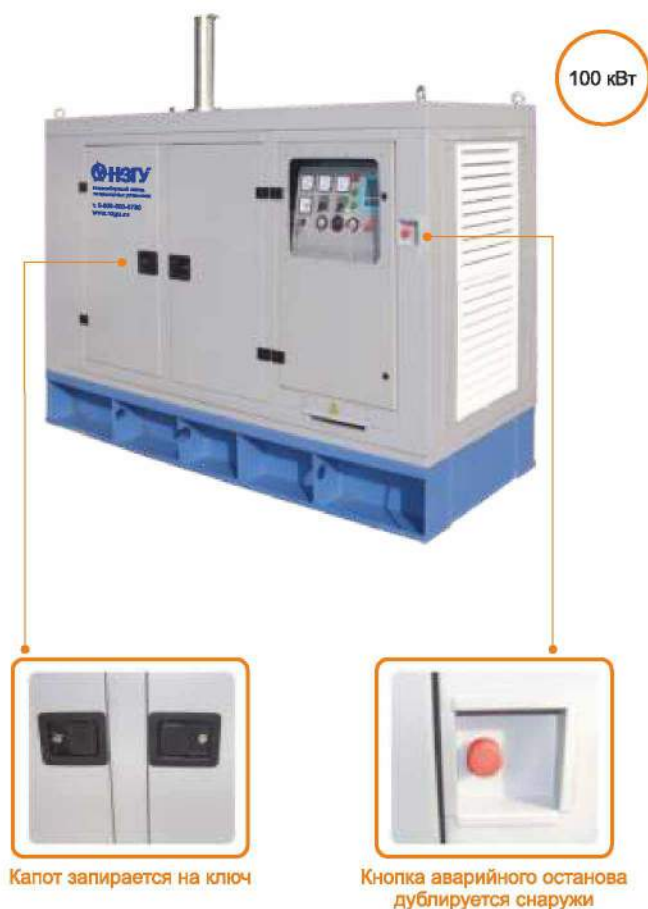
Капот запирается на ключ