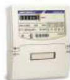
Электрический счетчик 6 руб./кВт ч.