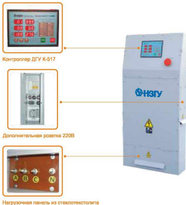
Контроллер ДГУ К-517