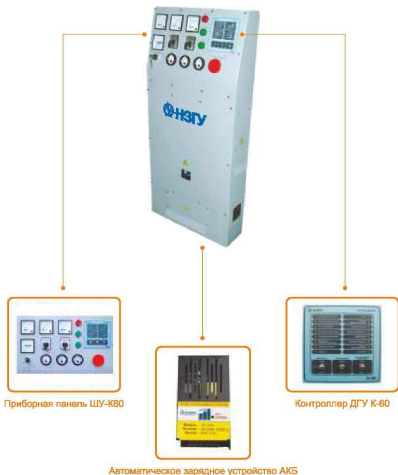
Приборная панель ШУ-К60